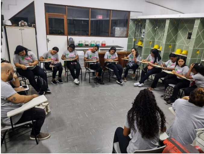
Imagem 2 – aplicação de teste de personalidade no IP Mangueira