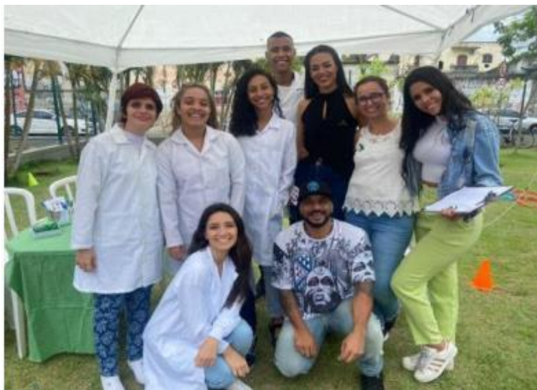
Imagem 1 – feira de anatomia e fisiologia (circuito e bem-estar no Parque Madureira)