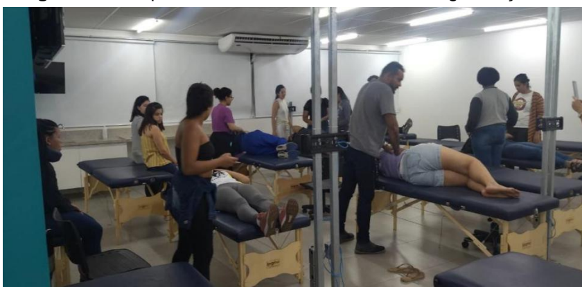
Imagem 2 – Aula prática sobre técnicas manuais de higienização brônquica