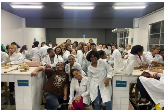
Imagem 2 – laboratório de anatomia – Centro Universitário Celso Lisboa