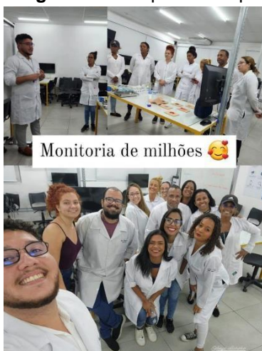
Imagem 1 – aula prática de pé diabético

A fim de ter o melhor aproveitamento das aulas práticas, tão importantes para a formação dos graduandos em Enfermagem, as monitoras também acompanharam e auxiliaram no desenvolvimento das respectivas atividades, mais uma vez oferecendo suporte conforme a necessidade. Um exemplo para ilustrar isso foi a aula prática sobre pé diabético, que contou com a presença das monitoras do núcleo 6 e de alguns membros da Liga Acadêmica de Dermato e Estoma da Celso Lisboa (LADECEL), que trouxeram simuladores de feridas. Abaixo alguns registros da monitoria, nas imagens de 1 a 4.