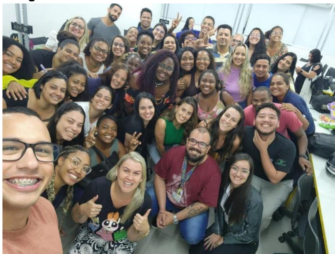
Imagem 3 – Núcleo 6 do turno da noite