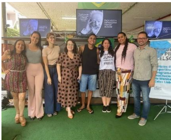
Imagem 5 – Encontro do PIM Celso, realizado no pátio da Celso Lisboa