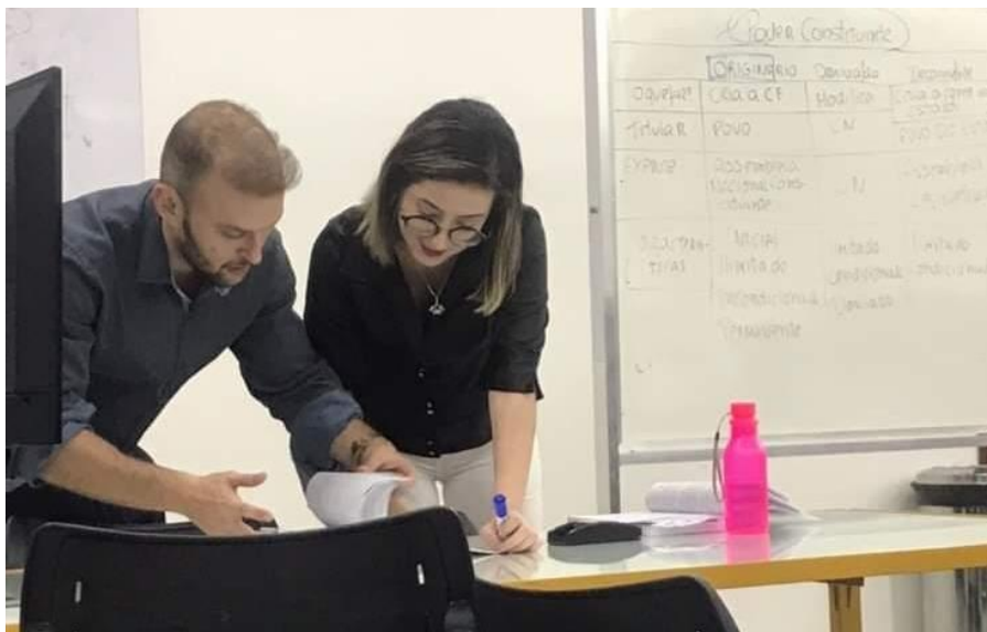
Imagem 1 – orientação para tempo de aula de exposição

atualmente em alta em provas jurídicas, ajudando os estudantes na sua preparação, a longo prazo, tanto para os próximos períodos e disciplinas, quanto para o exame da OAB (Ordem dos Advogados do Brasil) e concursos diversos. Além de outras atividades em colaboração com o professor, tive a oportunidade de ministrar uma aula sob a supervisão do meu orientador. Essa atividade foi a que mais me desafiou como aluna e monitora, visto que encarar um grande público sempre foi um desafio para mim. Essa foi a virada de chave para abandonar a figura de uma simples aluna em sala e me posicionar como monitora, compartilhando com os demais o conhecimento adquirido em semestres anteriores. Mais do que como monitora, me descubro com um sonho antes oculto: a docência. A Imagem 1 mostra um momento de interação com o professor orientador.