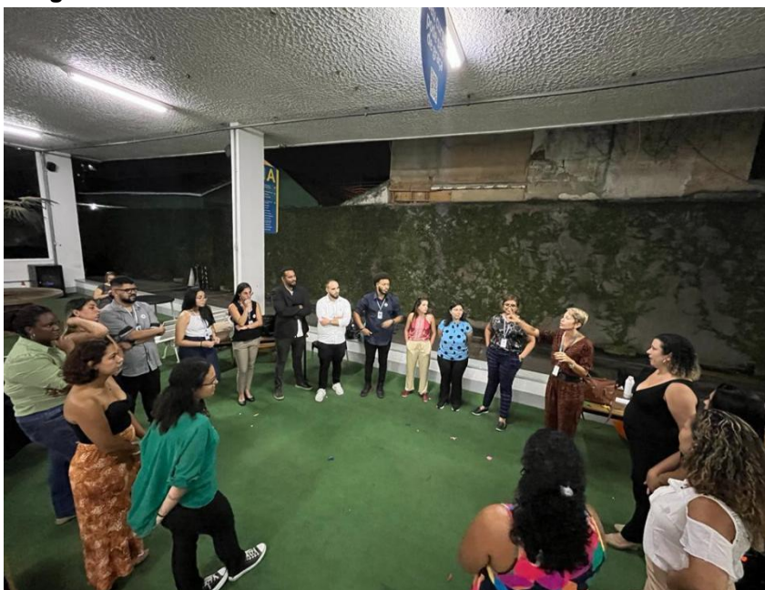
Imagem 1 – dinâmica de encerramento