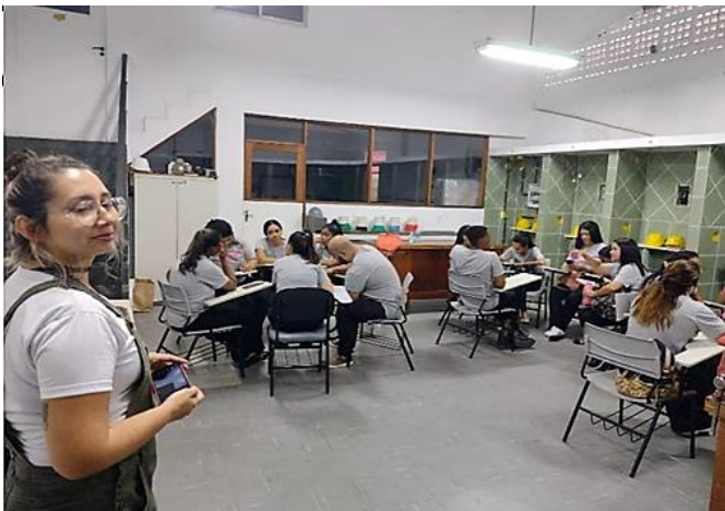
Imagem 1 – aplicação de dinâmica no IP Mangueira