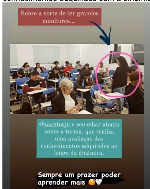
Imagem 2 – auxiliando e monitorando os alunos enquanto realizavam um quiz sobre os conhecimentos adquiridos com a dinâmica aplicada