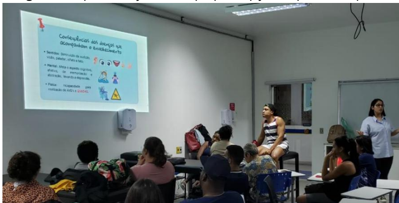
Imagem 1 – apresentação sobre propriocepção, equilíbrio e quedas em idosos

Foram elaboradas e aplicadas revisões teóricas e dinâmicas, contendo o conteúdo abordado em cada ciclo, com o objetivo de auxiliar o aprendizado dos alunos e prepará-los para as avaliações. Ademais, houve participação ativa durante a avaliação dos projetos dos alunos considerando-se o desempenho, a apresentação e o material exposto por eles. As imagens 1 e 2 mostram um pouco das atividades desenvolvidas.