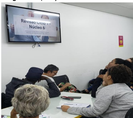
Imagem 2 – aplicação de revisão teórica do Ciclo 1