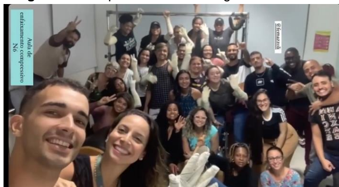
Imagem 3 – aula prática sobre drenagem linfática e enfaixamento