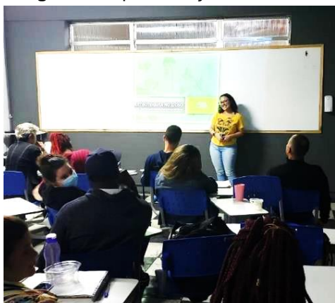
Imagem 1 – apresentação sobre eletroterapia e exercício físico no idoso

Também auxiliamos nas aulas práticas, ajudando os alunos a aprender e aplicar técnicas dentro do escopo da referida disciplina, e ajudando a professora a ensinar. Isso dinamizou muito as aulas, visto que há muitos alunos por turma, e as aulas práticas exigem ação e atenção. Participamos, ainda, das revisões teóricas, práticas e dinâmicas, tanto na confecção quanto na realização durante as aulas, o que nos induzia a sempre estar com a matéria em dia para que pudéssemos tirar dúvidas. Toda semana os alunos tinham que resolver as “Situações de Aprendizagem” (S.A), e nós, monitoras, ajudamos a professora na correção das respostas. Ao final de cada ciclo, os alunos apresentavam os projetos para compor nota. A nossa participação foi de colaborar na produção do trabalho com dicas e ajustes, se fossem necessários, até o dia da apresentação, quando avaliamos os projetos junto com a professora e pudemos corrigir e opinar sobre. As imagens abaixo ilustram um pouco das atividades desenvolvidas.