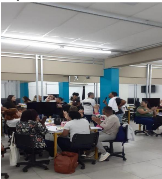
Imagem 1 – sala de aula – Centro Universitário Celso Lisboa