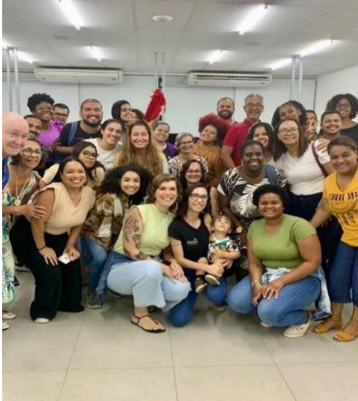
Imagem 1 – palestra sobre diversidade e cultura (OLX BRASIL) - 18/10/2022