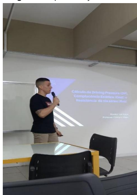
Imagem 3 – apresentação sobre Mechanical Power