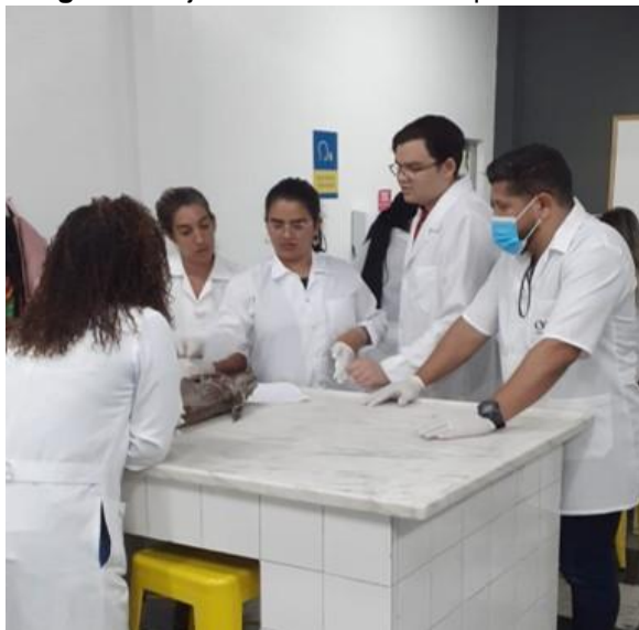
Imagem 1 – ajuda aos alunos com questão durante aula de anatomia