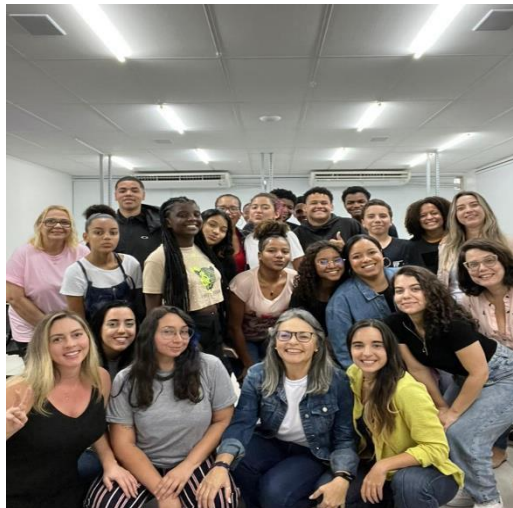
Imagem 3 – turma Vida & Trabalho Celso Lisboa 2022.2