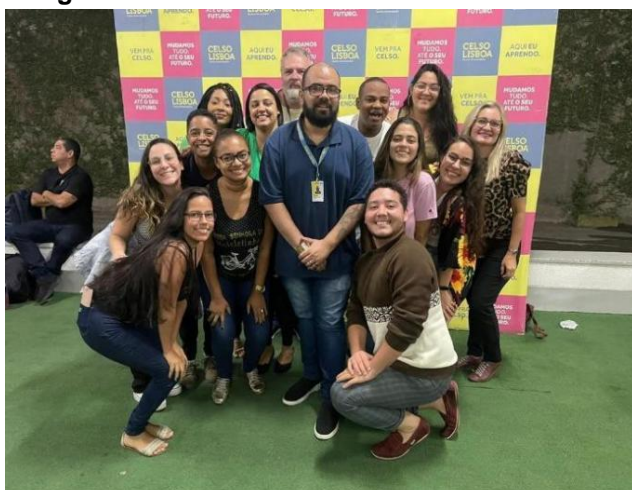
Imagem 4 – alunos do Núcleo 6 do turno da noite