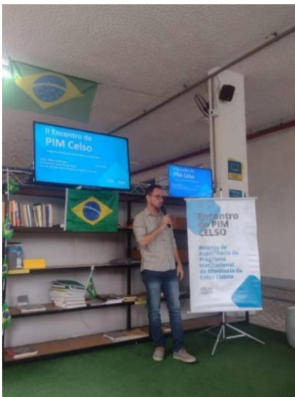
Imagem 1 – apresentação do relato de experiência

Atuamos como elo na organização de evento entre a Celso e OAB/RJ 55ª Subseção – Méier, o que mostra a importância de parceiras no crescimento da escola de Direito. A reunião do colegiado foi primordial para apresentar ao corpo de mestres as necessidades do curso pela ótica de aluno. A confiança do professor em nos apresentar diversos desafios fez com que nossa capacidade de aprender tivesse ganhos valiosos. O desenvolvimento de atividades didáticas utilizando a ferramenta Liga Online (plataforma institucional) nos permitiu entender a magnitude do processo de criação de conteúdo a ser publicado para os alunos. O coroamento do PIM teve sua apoteose com o II Encontro do PIM, ao final do semestre, ocasião na qual pudemos, além de expor relatos de experiência, ter uma troca com alunos de diversos cursos de graduação do Centro Universitário Celso Lisboa. A imagem 1 mostra o referido evento.