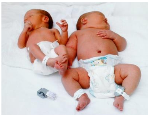
Figura 2: Comparação de um bebê de tamanho e peso normal com um bebê macrossômico.

Gestantes portadoras de Diabetes mellitus não tratadas têm o maior risco de rotura de membranas, parto prematuro, feto com apresentação pélvica e feto macrossômico (SBEM, 2008).